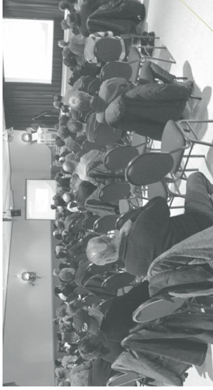
Conférence Branchons les PME de la Mitis: un bon moyen d'informer les gens d'affaires sur les nombreuses possibilités et avantages qu'offrent un site Web bien conçu.